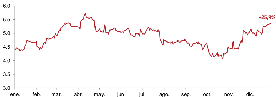
Evolución bursátil de Talgo vs. Ibex 35 y EuroStoxx 50 el periodo enero-diciembre 2018